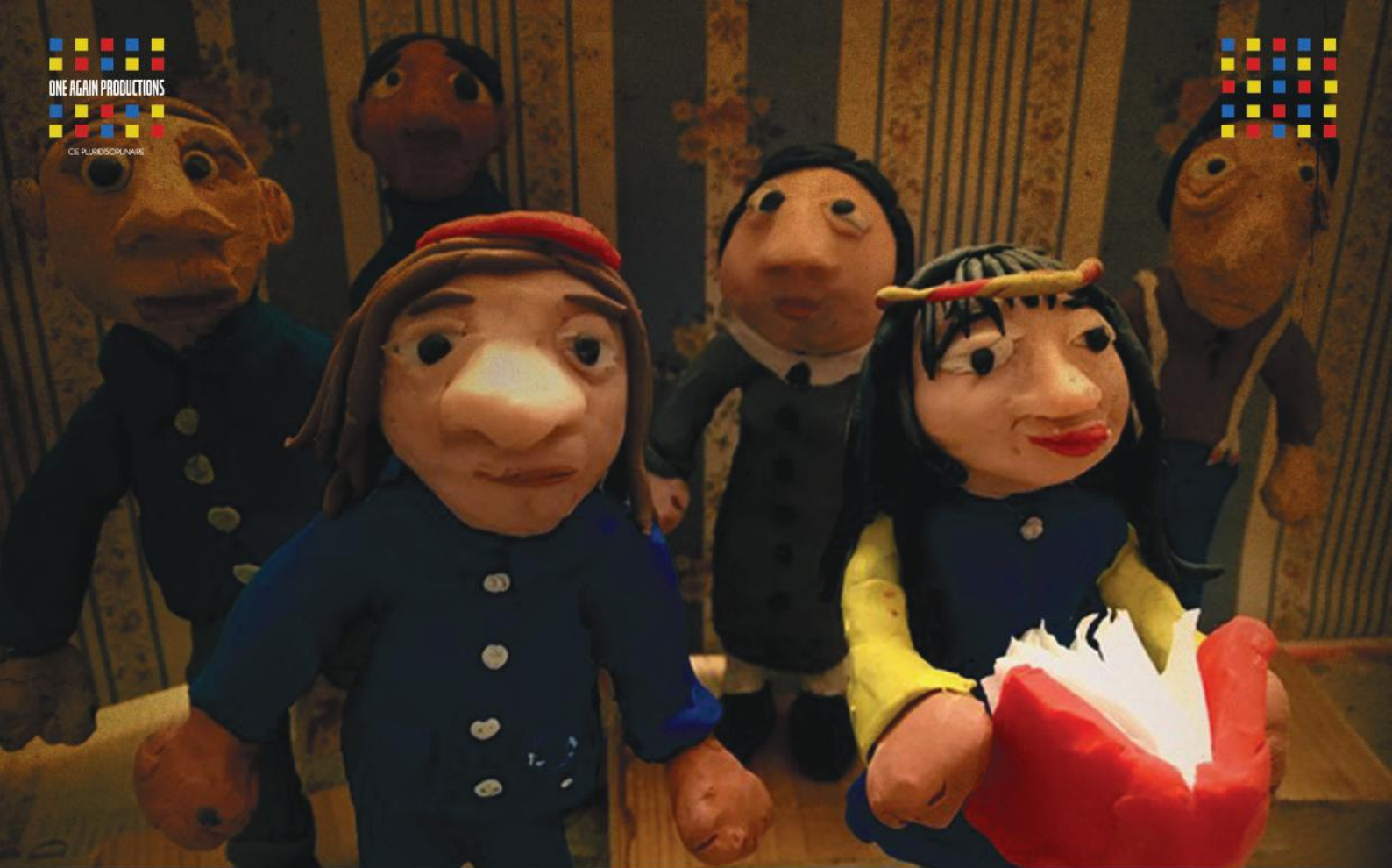
Stop Motion Pâte à modeler et décor